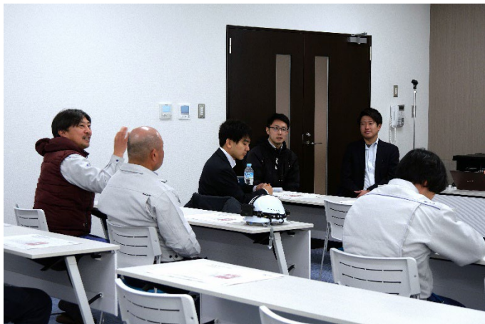
写真 3：意見交換会の様子