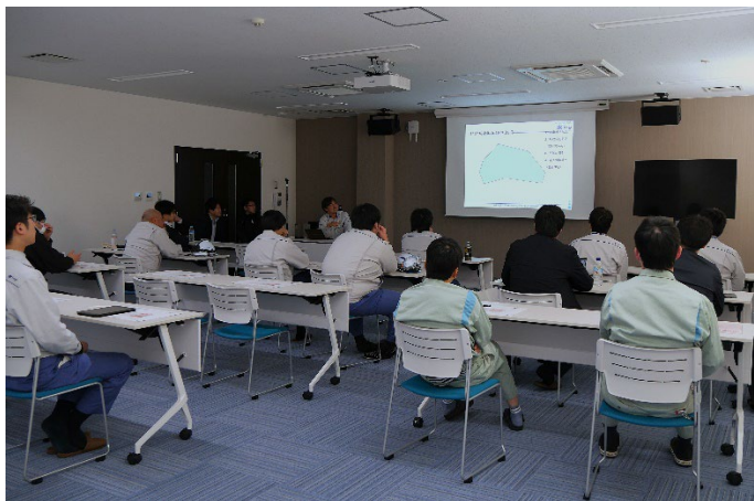
写真 2：講義中の様子

研修会では、汚泥再生処理センターの営業、設計、建設を担当した当社社員が業界動向や最新のし尿処理技術について講義を行い、一連の処理プロセスや設備の特徴について詳しく解説しました。また、参加者同士の意見交換や質疑応答の時間も設けられ、実務に即した知識の共有が行われました。