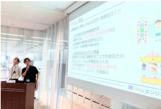
写真：若手社員によるプレゼンテーションの様子

第一回目の当日は、水 ing バリュー推進を目的とした全社イベントの後に開催したこともあり、若手から経営層まで約100人が参加し、世代・職位・職種を超えて交流しました。出入り自由で気軽に参加可能とし、様々な社員同士が軽食やドリンクを楽しみながらコミュニケーションをとる場となりました。会の中では2件のプレゼンテーションが披露され、若手社員による新たなコミュニケーション施策の提案や、全社プロジェクトの取り組みをクイズ形式で紹介するなど、交流に加えて楽しみながら新たな気づきや知識を得られる時間となりました。